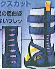
フレックスカット

衝撃緩衝性に優れた E.V.A.ミッドソール ミッドソールに軽量で弾力性に富んだE.V.A.採用。